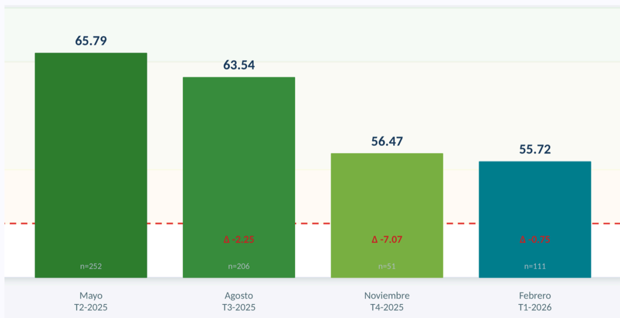
Gráfica 2. Evolución del Índice de Opinión Empresarial de Confianza Económica de la ZMT