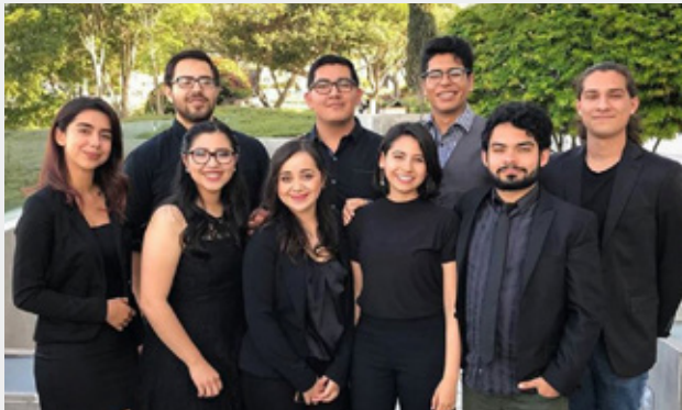
@chakon24k Un equipo listo para realizar proyectos que tengan un impacto en los estudiantes y en nuestra comunidad. #YoSoyCETYS #IndigoCETYS

Utiliza el hashtag #YoSoyCETYS para ver tu fotografía publicada en esta sección.