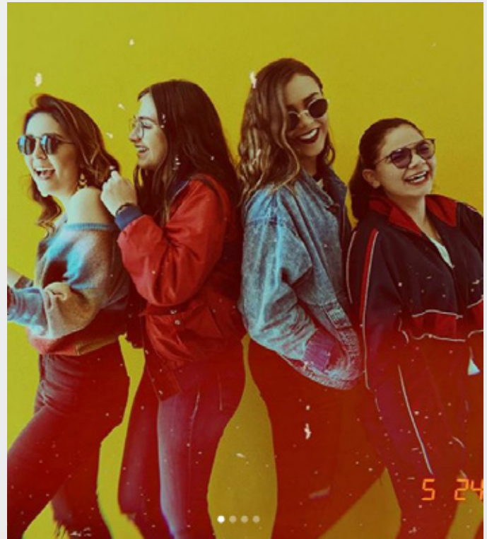
@cynthiaveg 80's con lo mejor de mi prepa #YoSoyCETYS