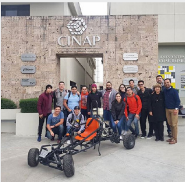
@ianglaser21 Cerrando con broche de oro #YoSoyCETYS