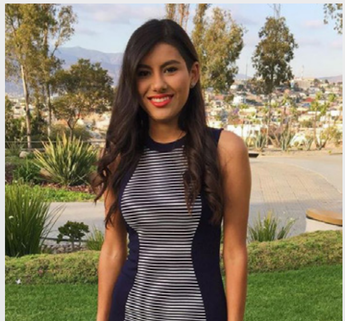
@marapdvz A un mes de ser Maestra en Psicología. #sipasolasmaterias #18añosestudiando#whatsnext #YoSoyCETYS