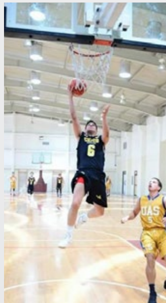
@gnevarez6 Can't wait #cetys #godsplan #slowgrind #YoSoyCETYS