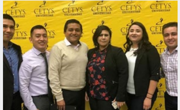
@kiosmaid Ingeniería en empaque #graduation #diplomado #cetys #guapos #YoSoyCETYS