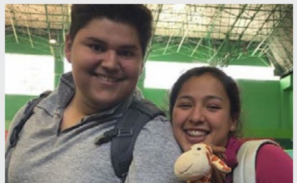
@lajirafita1 Espero sacarte una sonrisa con mis aventuras. #YoSoyCETYS