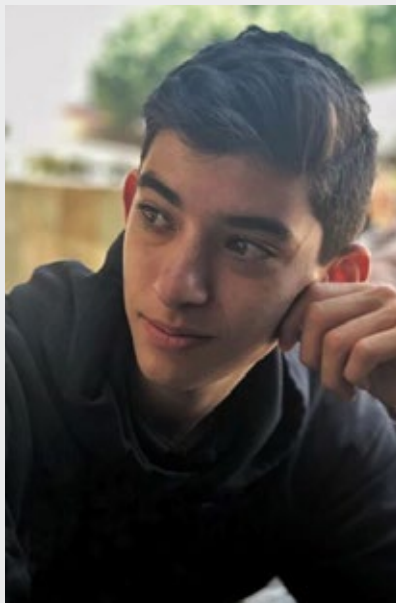
@hector_sandez03 "Pregúntate si lo que estás haciendo hoy te llevará a donde quieres llegar mañana" - Walt Disney - @charliez16 #cetys#YoSoyCETYS @cetys_tij