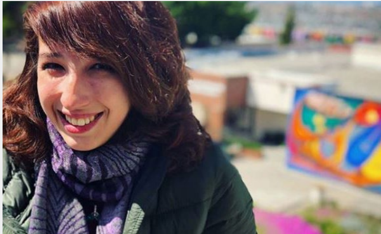
@lesliepurple #cetysuniversidad #cetystijuana #YoSoyCETYS #cetyscampustijuana #colorfulbackground #smile #wallart #sunnyday #beautifulday #me

Utiliza el hashtag #YoSoyCETYS para ver tu fotografía publicada en esta sección.