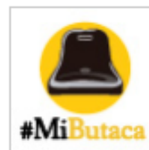
Mi Butaca Gimnasio- Auditorio Rodrigo Valle Hernández